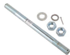
545098003200 LEDHighbay-Pole and Adapter