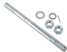
545098003200 LEDHighbay-Pole and Adapter