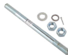
545098003200 LEDHighbay-Pole and Adapter