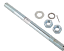
545098003200 LEDHighbay-Pole and Adapter