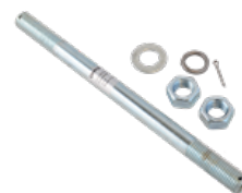
545098003200 LEDHighbay-Pole and Adapter