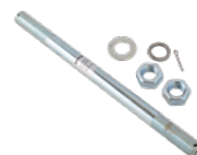
545098003200 LEDHighbay-Pole and Adapter