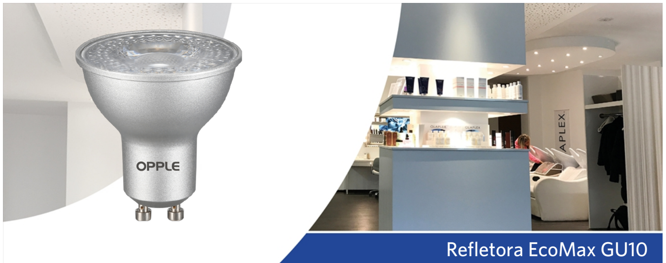
Refletores EcoMax GU10