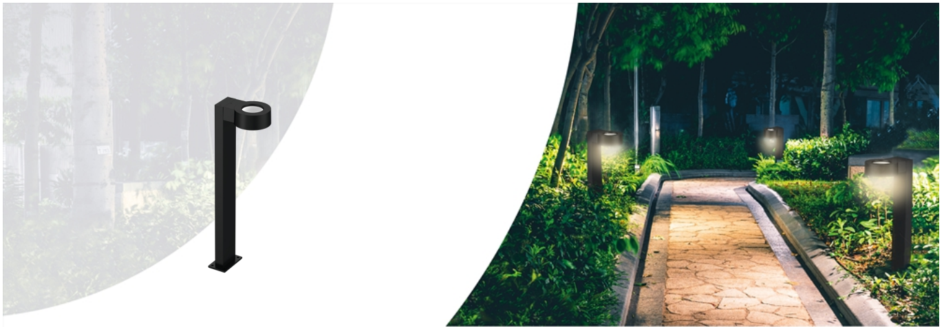
Tuin-/voetpadverlichting Bollard Luke