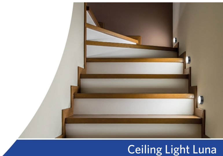
Ceiling Light Luna