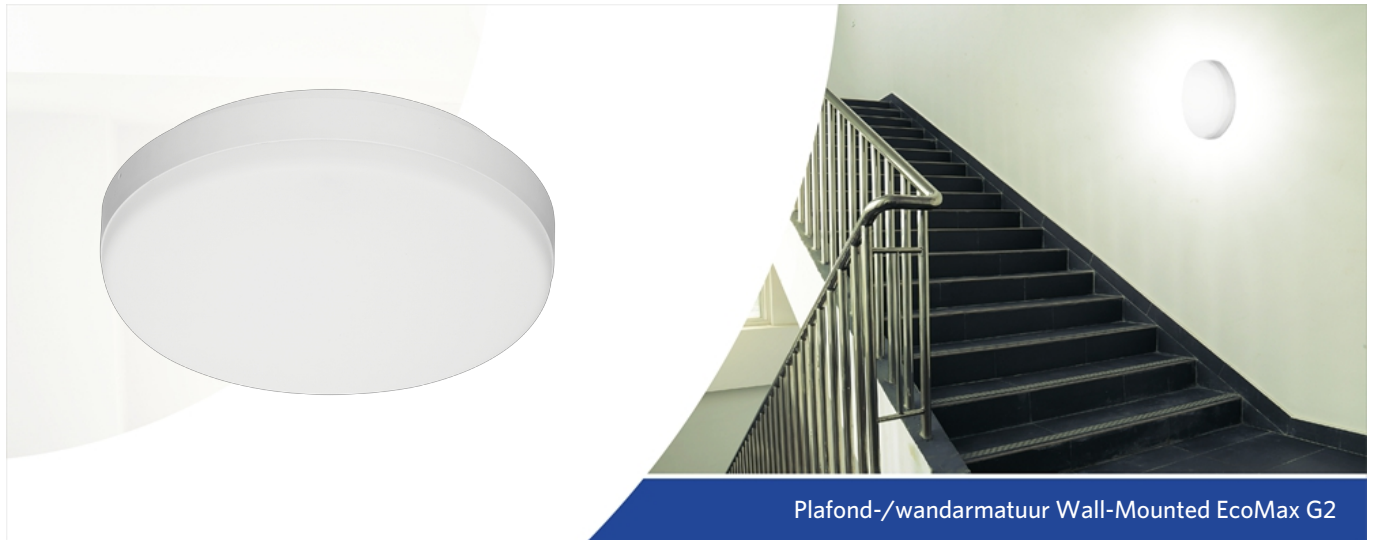
Plafond-/wandarmatuur Wall-Mounted EcoMax G2