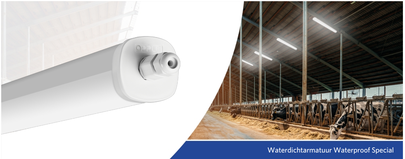
Waterdichtarmatuur Waterproof Special